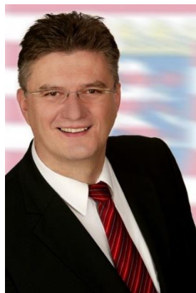
Rafael Reißer Bürgermeister